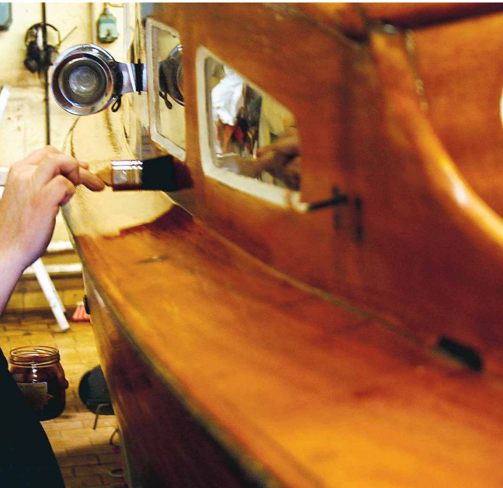
nga timmar i verkstan också.