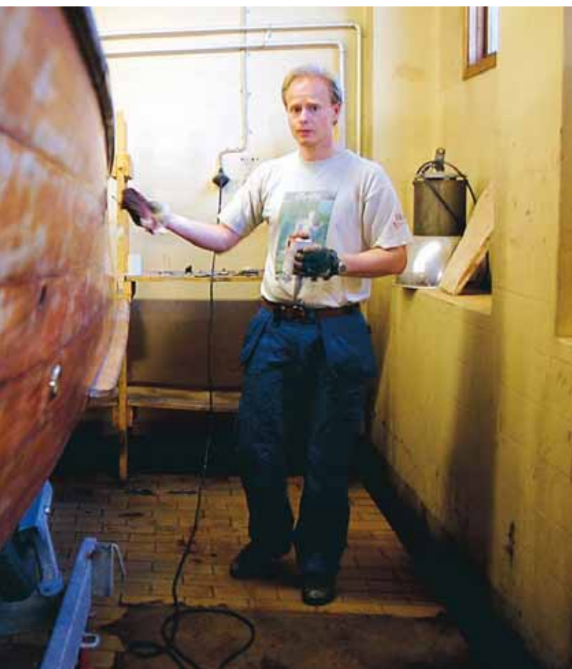
berg? Nej, han hinner nog klart i år